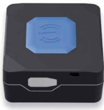
Im Mountaintart verbaute Sensorik.

Im nächsten Schritt werden die Daten innerhalb der Webapplikation aufbereitet, um einerseits den laufenden Betrieb zu unterstützen, andererseits werden sie für die Optimierung des Langzeitbetriebs herangezogen. So wird z. B. durch die Protokollierung der Anzahl an Fahrten pro Mountaintart bzw. der zurückgelegten Strecke (gesamt und seit dem letzten Service) eine bessere Planbarkeit von routinemäßigen Wartungstätigkeiten ermöglicht.